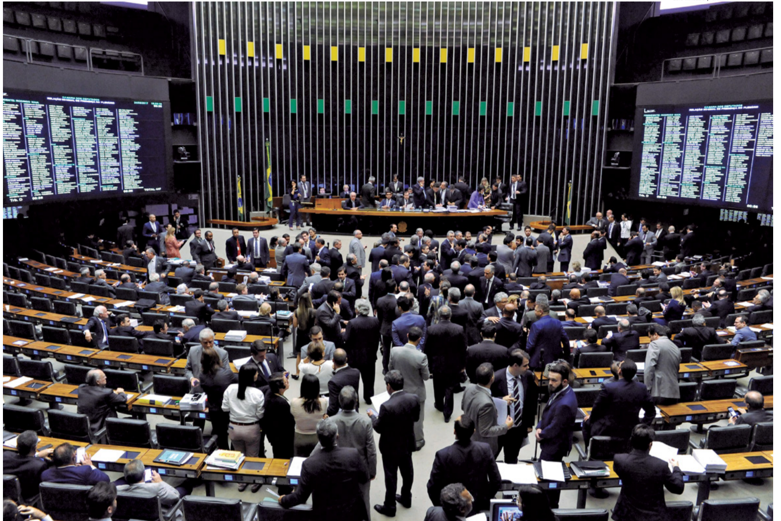
LUIS MACEDO / CÂMARA DOS DEPUTADOS